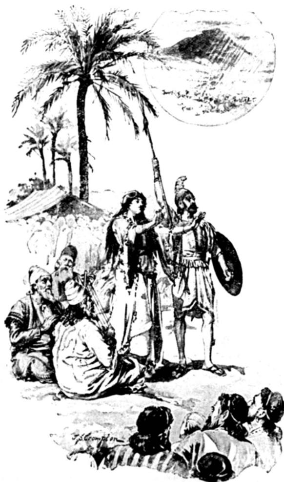
THE SONG OF DEBORAH AND BARAK.—Judges v. 1.

向耶和华哭诉时，“他兴起拯救他们的士师”。这些民族英雄有时被称做“拯救者”，但被说得最多的还是他们一定年限后要“审判以色列”。显然它赋予了“示师”这个词新的含义，即在战争中是领袖，在和平期是统治者。他们其实更甚于领导者和统治者，因为他们被赋予了神的神圣力量，拯救和保护以色列民，建立神的国。